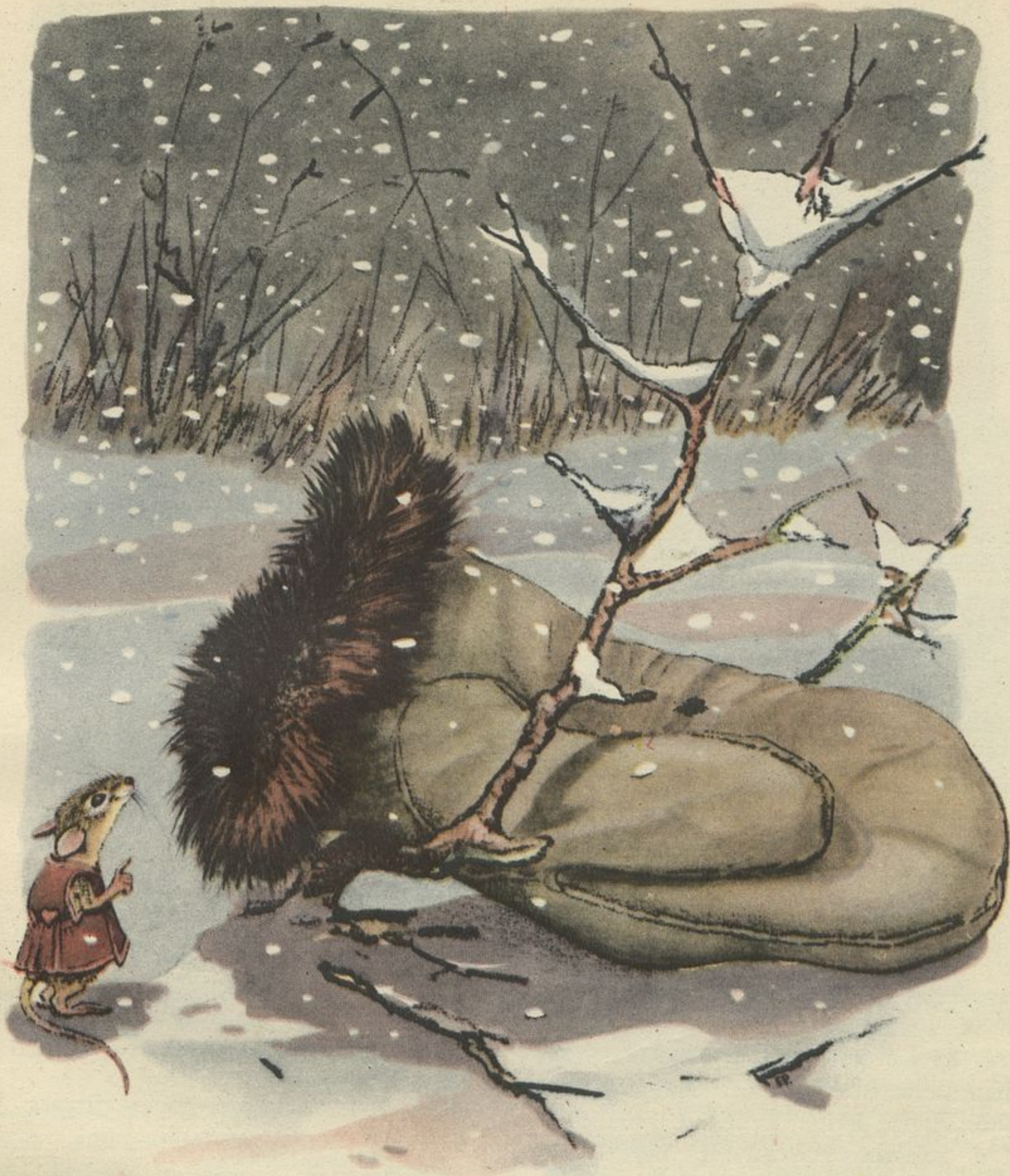
Рис. Е. РАЧЁВА