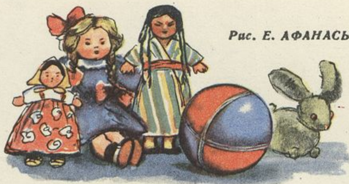
Рис. Е. АФАНАСЬЕВОЙ