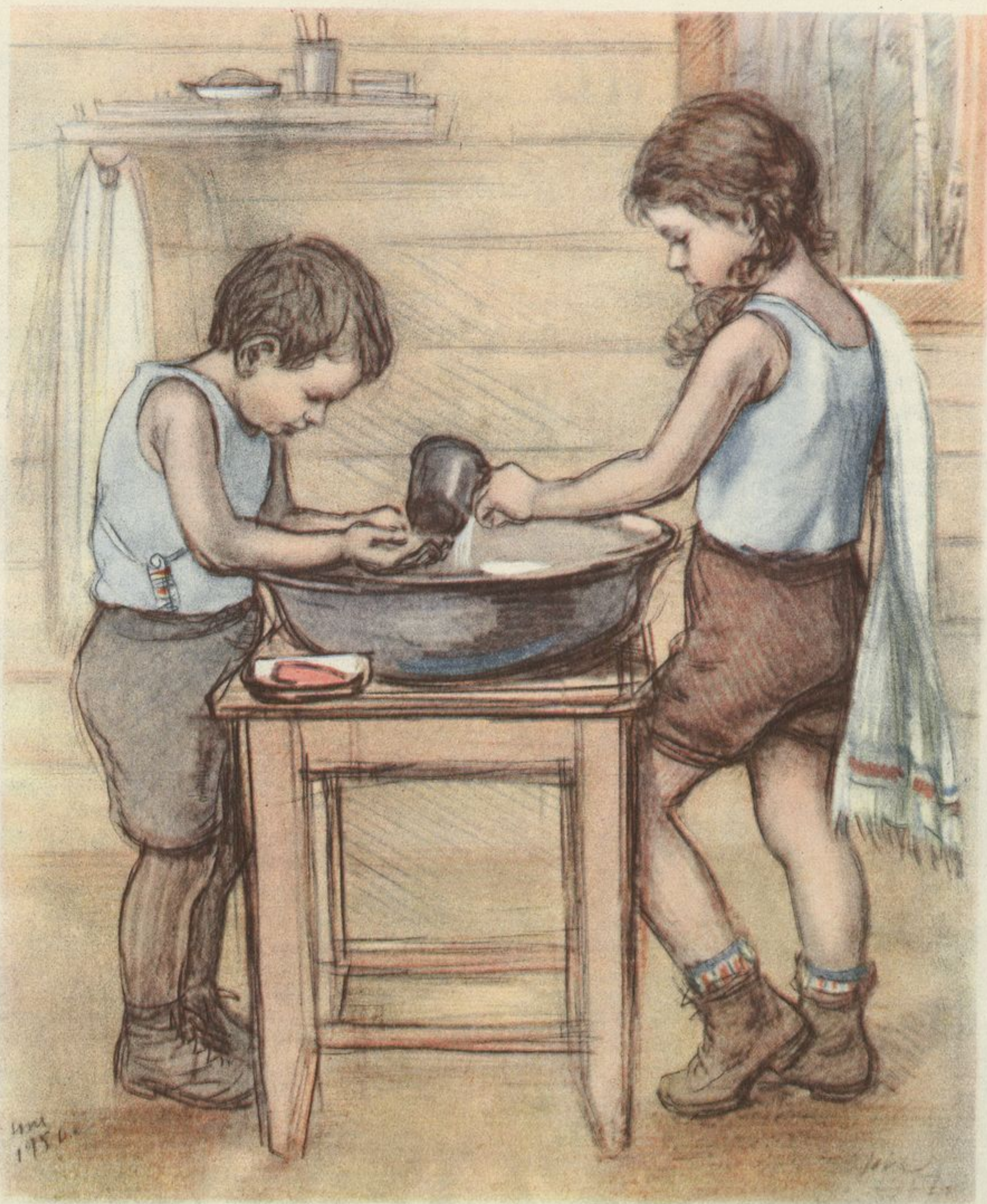
Утро на даче.