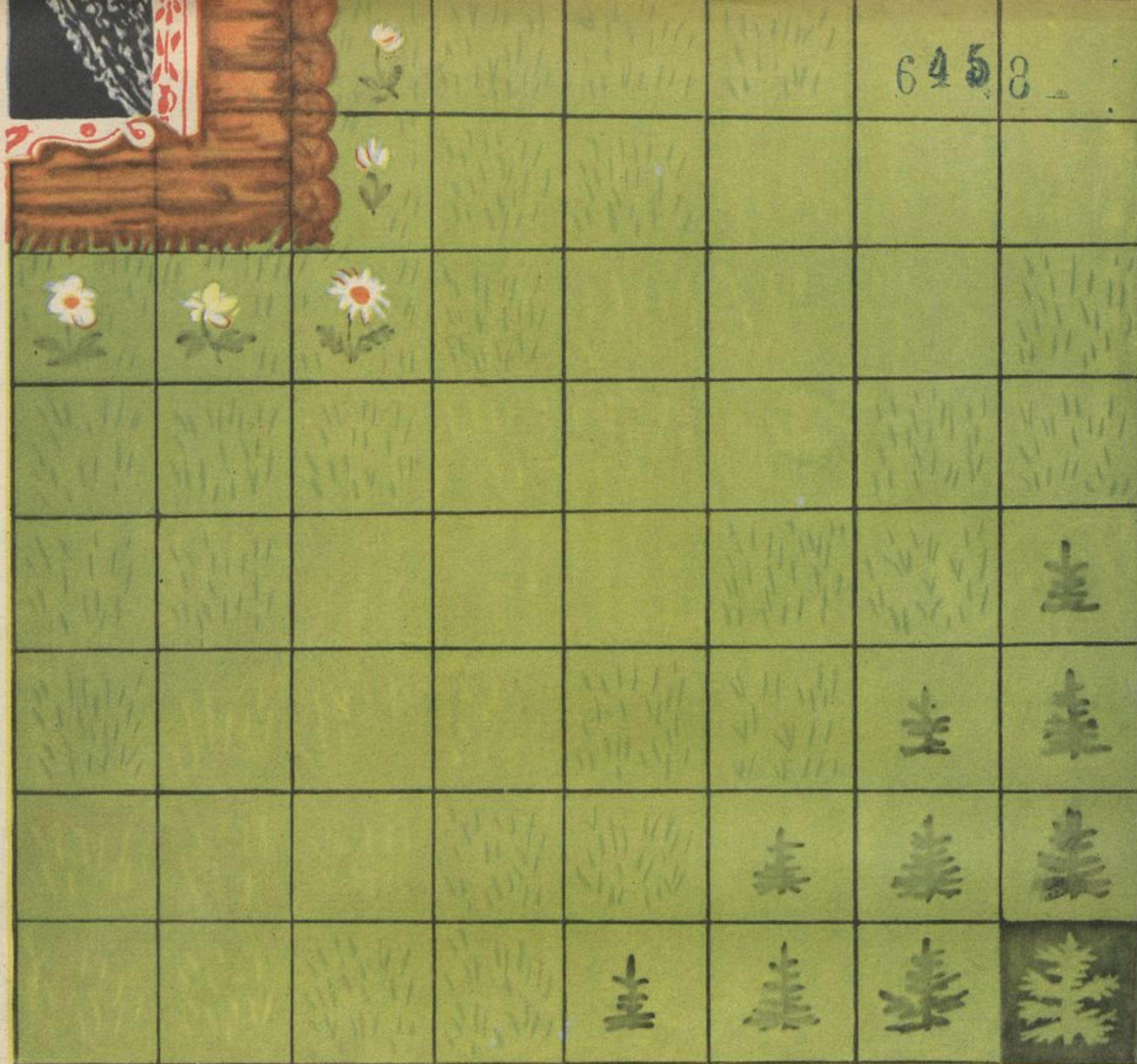
Рис. А. ПОРЕТ