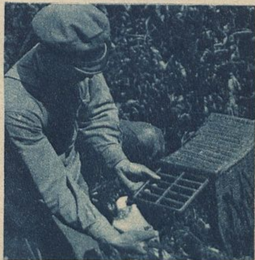
В этой корзине отвезут Хохлика к месту выпуска.