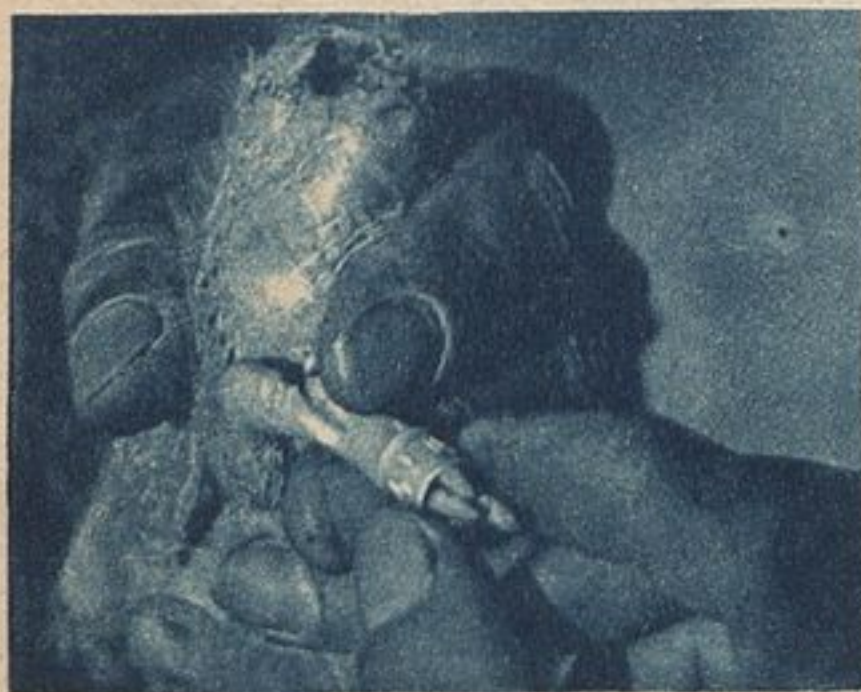
Хохлику надевают кольцо.