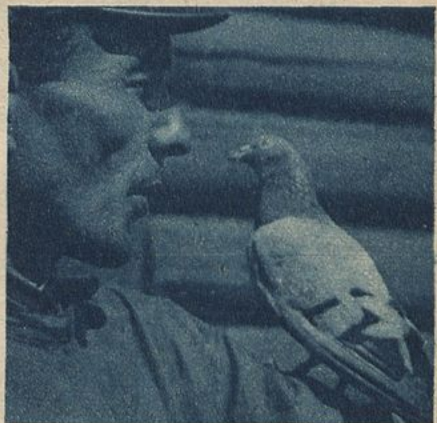
Голубевод прощается с Хохликом.