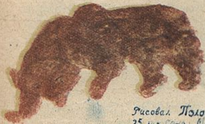
Рисовал. Полосков 25 шк. Сокол. Вирский