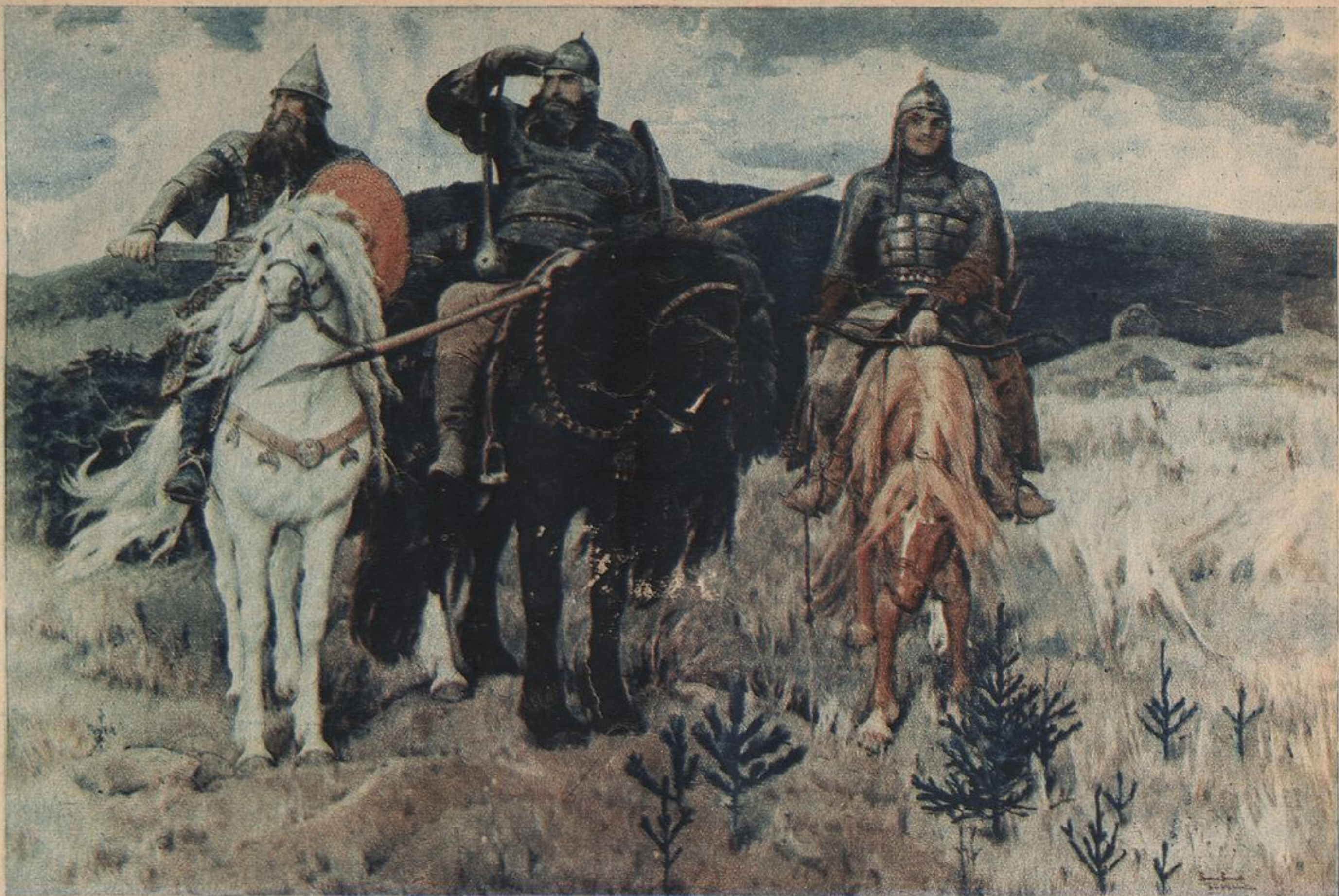
„Богатыри“. С картины известного художника В. Васнецова.