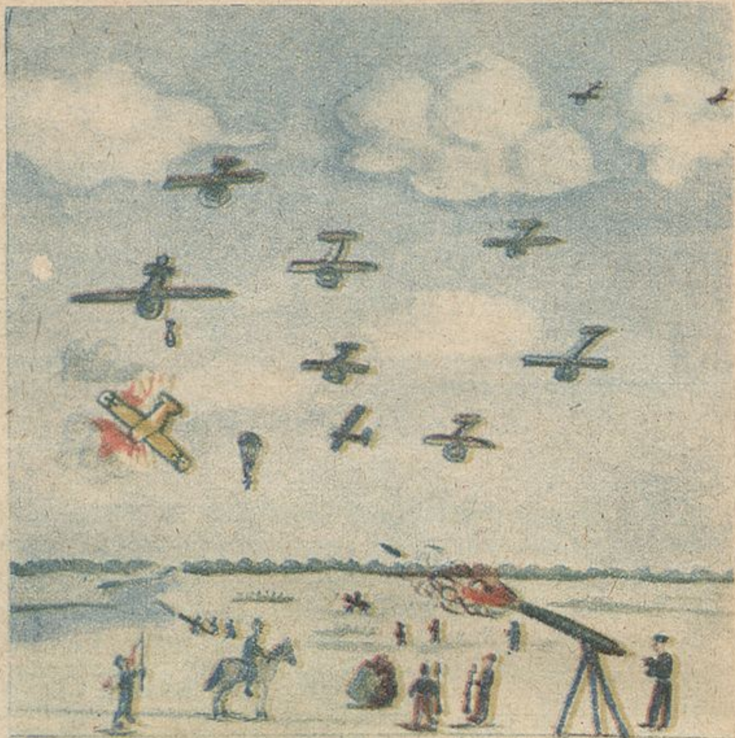
Республиканские истребители и бомбовоз сбили фашистский самолет „Гейнкель“. Рисовал Игорь Шмелев, г. Выкса.