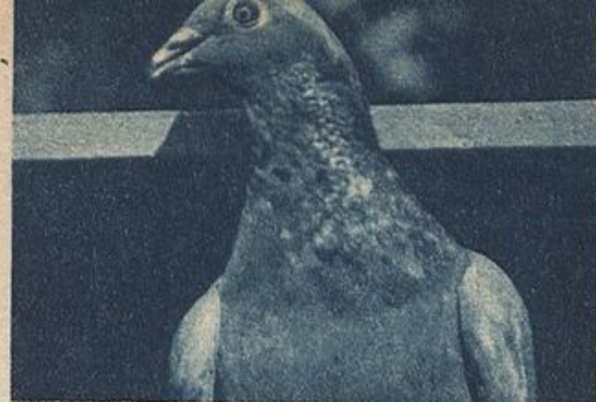
Хохлик — настоящий почтовый голубь.

Почтовые голуби как средство связи могут быть использованы не только в мирное время — в колхозах, совхозах, на рыбных промыслах, на речном транспорте, но и в боевой обстановке.