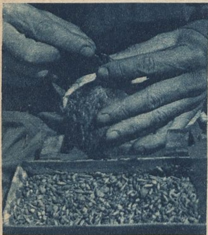
Голубевод кормит Хохлика.